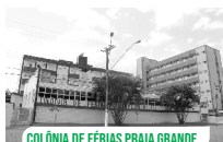
COLÔNIA DE FÉRIAS PRAIA GRANDE